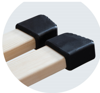
Tacos de goma antideslizantes