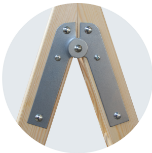
Bisagra de acero reforzado